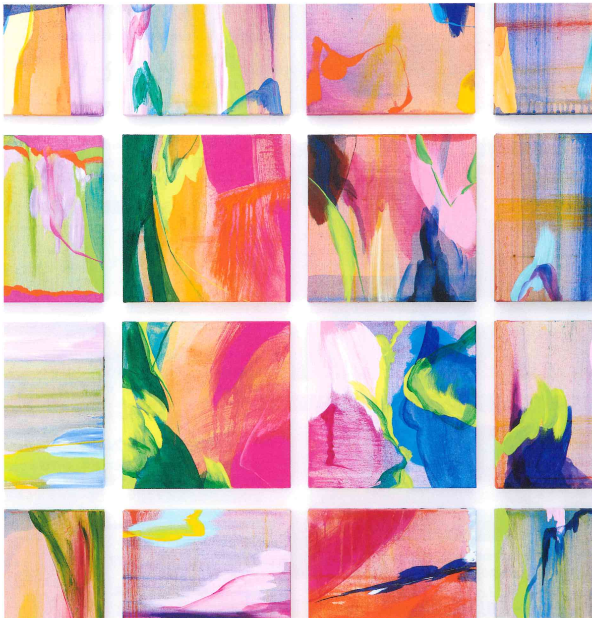
流麻二果 “スクエア Square”

52nd International Home Care and Rehabilitation Exhibition & Forum